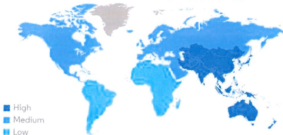
تصویر ۱- رشد بازار محصولات شوینده در سال‌های ۲۰۲۲ تا ۲۰۲۷

بر خلاف کشور چین که رشد تقاضای قابل توجهی در بخش صنعتی به مواد شوینده خواهد داشت، در کشور هند افزایش ابتکارات دولتی و آگاهی برای داشتن یک زندگی سالم در میان جمعیت روستایی هند به افزایش فروش مواد شوینده در این کشور کمک خواهد کرد. تصویر زیر رشد بازار محصولات شوینده را به تفکیک منطقه جغرافیایی نشان می‌دهد: