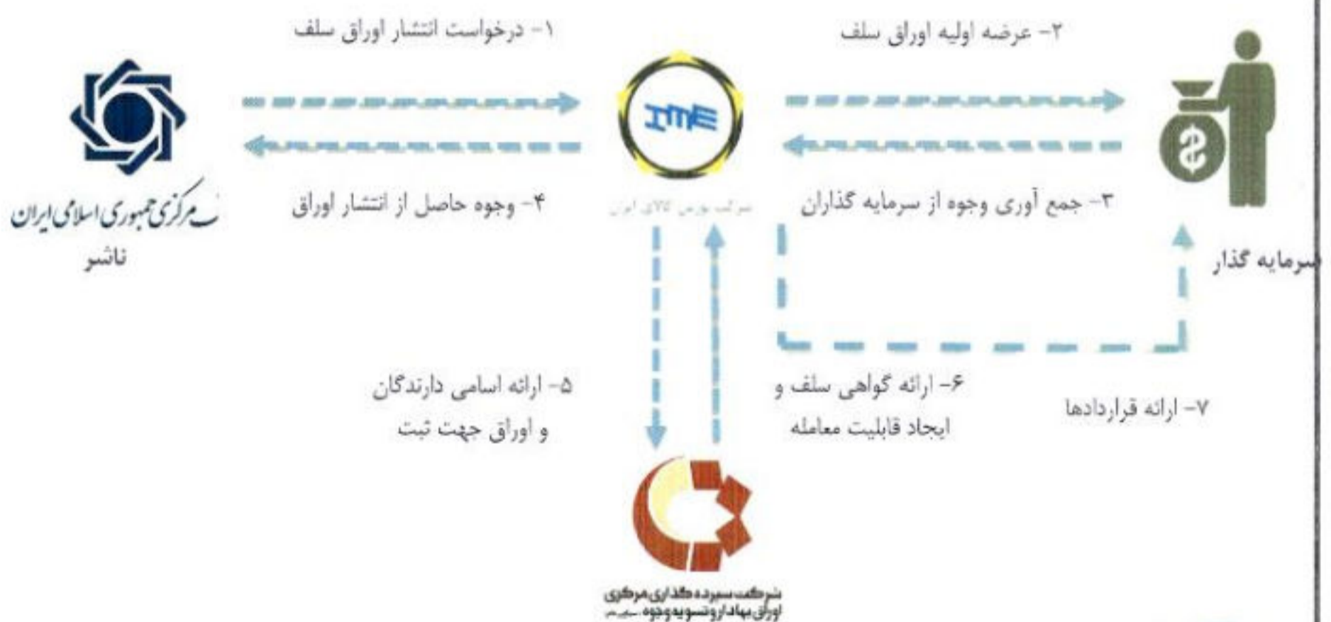
شکل ۱. فرآیند عرضه اولیه اوراق سلف موازی استاندارد

قراردادهای سلف موازی استاندارد سکه بانک مرکزی جمهوری اسلامی ایران، با عاملیت و بازارگردانی بانک مرکزی جمهوری اسلامی ایران به روش گشایش نماد عرضه می شود. سرمایه گذاران علاقه مند به خرید این اوراق می توانند با مراجعه به کارگزاری های دارای مجوز و پس از اخذ کد معاملاتی و پس از بررسی و مطالعه شرایط مندرج در این امید نامه اقدام به خرید بر گه های مذکور نمایند. شایان ذکر می باشد به دلیل محدود بودن حجم اوراق انتشار یافته، اولویت تخصیص بر اساس ترتیب درخواست متقاضیان خواهد بود. شایان ذکر است اوراق مذکور تنها نشان دهنده تعداد اوراق در دسترس و قابل نقل و انتقال توسط خریدار می باشد و صرفاً جهت اطلاع چاپ می گردد. تسویه این اوراق توسط شرکت سپرده گذاری مرکزی اوراق بهادار و تسویه وجوه بر اساس حجم اوراق در دسترس خواهد بود. فرآیند عرضه اولیه اوراق سلف موازی استاندارد در شکل زیر نمایش داده شده است.